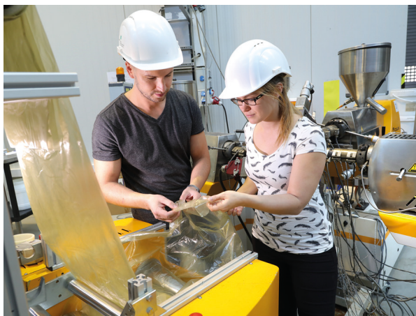
Der CreaSolv®-Prozess ermöglicht das Recycling von Verpackungen aus Mehrschichtlaminaten.

Die Projektkoordination übernimmt die Lober GmbH & Co. Abfallentsorgungs KG, die als künftiger Betreiber der ersten CreaSolv®-Anlage* in Deutschland auftritt. Das Fraunhofer-Institut für Verfahrenstechnik und Verpackung IVV aus Freising hat das Recyclingverfahren entwickelt und den Scale-up aus der Forschungsumgebung in den technischen Maßstab durchgeführt. Die LÖMI GmbH liefert Anlagen für lösungsmittelbasierte Fertigungsprozesse und hat gemeinsam mit dem Fraunhofer IVV Prozessaggregate für den gesicherten Pilotanlagenmaßstab entwickelt.